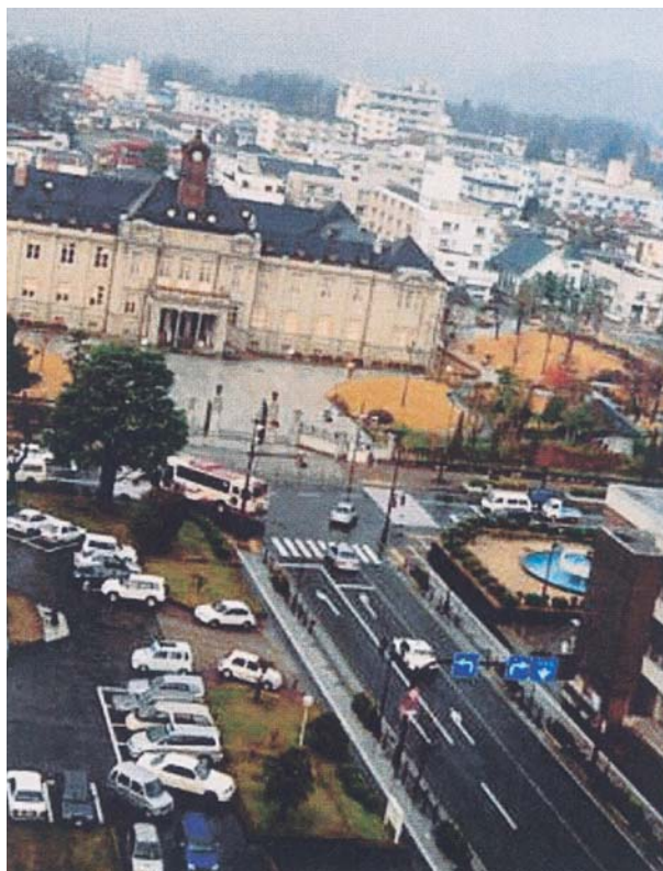
写真1 文翔館と周辺市街地

文翔館は山形県が誇る歴史的建造物、国の重要文化財である。その前身は旧山形県庁で、米沢出身の建築家・