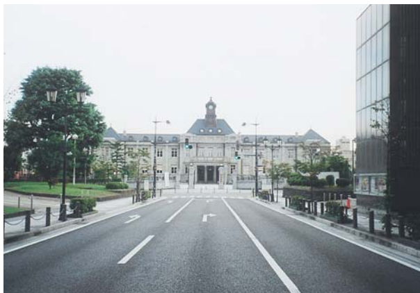
写真4 門型の交通標識・整備前（上）と撤去・整備後の景観（下）