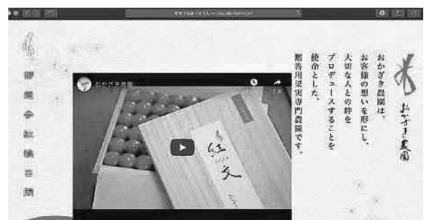
図1 おかざき農園webページ http://www.okazaki-farm.com/

地方産業のブランド化やソフト産業の集積をさらに推し進めるには、人材が不足していることは明らかである。企業はそれぞれ、研究から企画、設計、試作、製造、広報、販売、顧客のアフターサービスまで取り組む必要があるが、下請企業の多い地方は製造部門中心になっている。