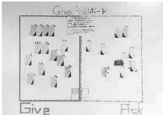
図4 マッチングボード