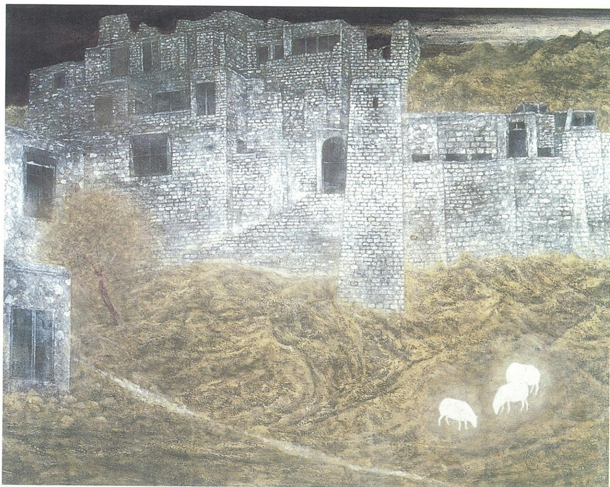
「跡」(Remains) 909 × 727mm 1996年 紙本着彩