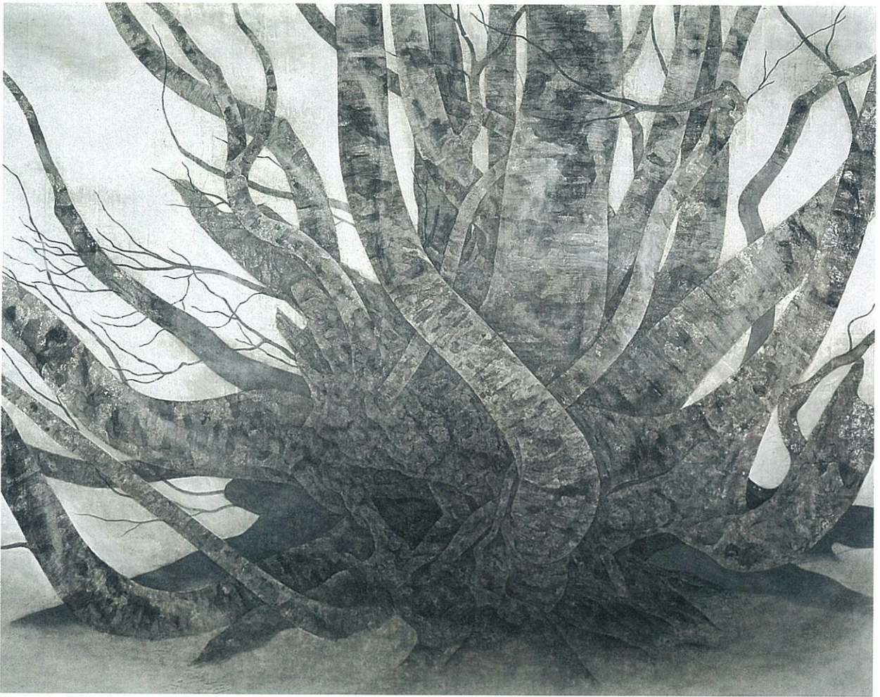
「樹」(Old Tree) 1,800×2,250mm 1995年 紙本着彩