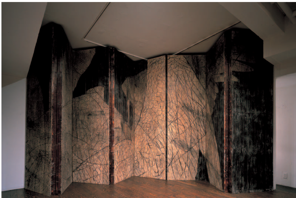
白澤 鳥 04-1