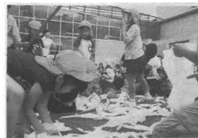
[写真4-21] 2012 6/22 読売新聞

◇：散らして みるのはトレ ットペーパーで はなく障子紙。 子どもたちが、思いつき り破った後の光景。 ◇：東北芸術工科大 学(山形市)の学生が、山 形県河北町で幼稚園児ら と楽しんだ創作活動の一 場面で、名付けて「あは れろいやふれ!!」。子ど もたちは自由に破いた紙 に好きな絵を描 き、貼り合わせて 大きな「作品」を 完成させた。 ◇：型に一切は まらない独創的な 仕上がり。ア ートを学ぶ人 の上をいつてか も」と学生たちも 真顔で感じて いた。(山形