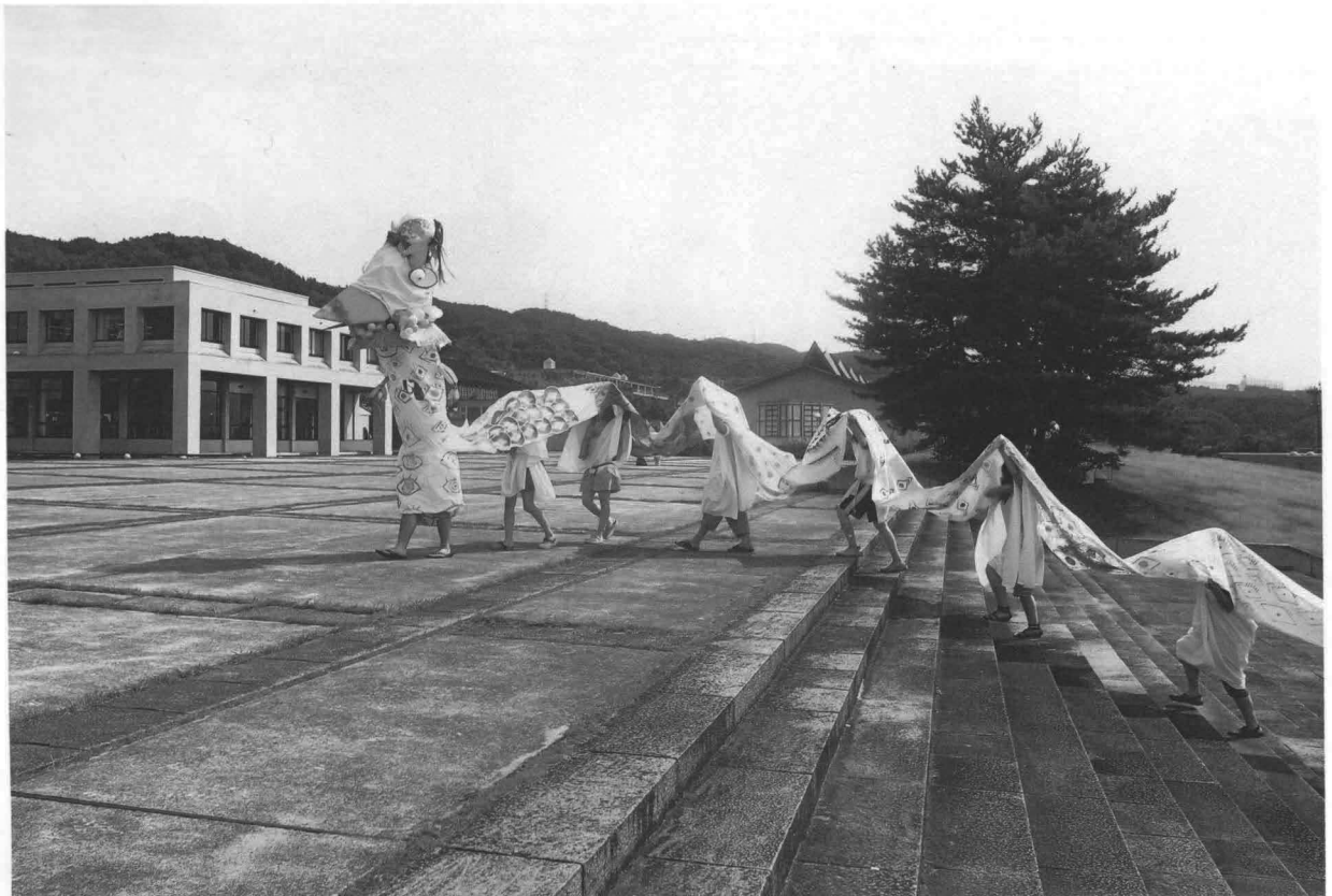
「龍神祭」本学の裏山(瀧山)は昔から龍の住処であり、この地を守護していると伝えられている。この龍神様に感謝の気持ちを込めて、手作りの衣装を身に纏って大学構内を練り歩くパフォーマンスを行った。