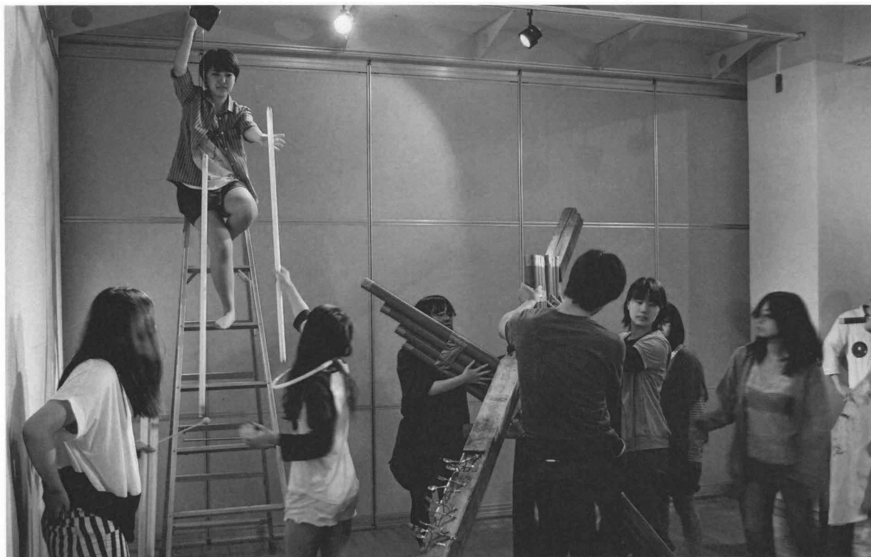
クラス作品展示の設営作業。皆で協力して作品を組み立てる。