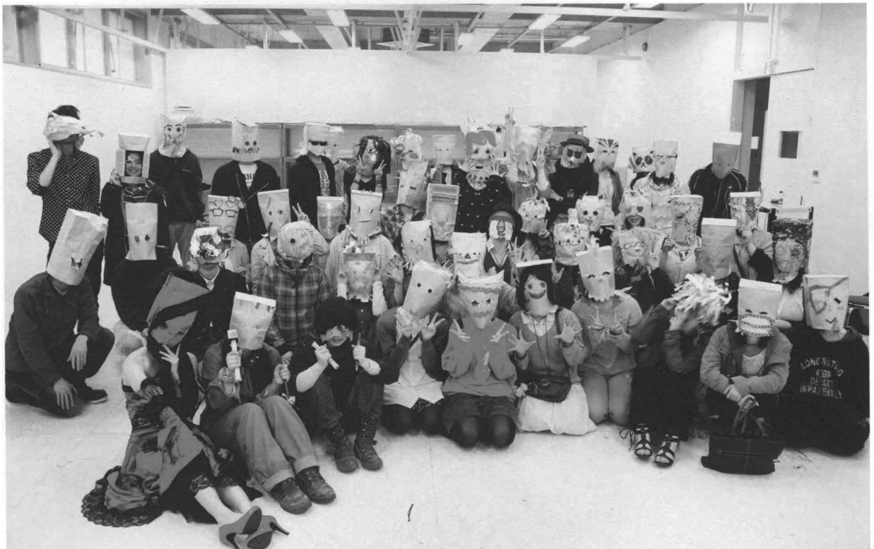
「身体表現／パフォーマンス」自画像のお面を被ったパフォーマンス後の記念写真。自分の誕生の瞬間から大学入学までの自分史をライフラインを参照にしながら振付符を作り、全身を使って表現した。