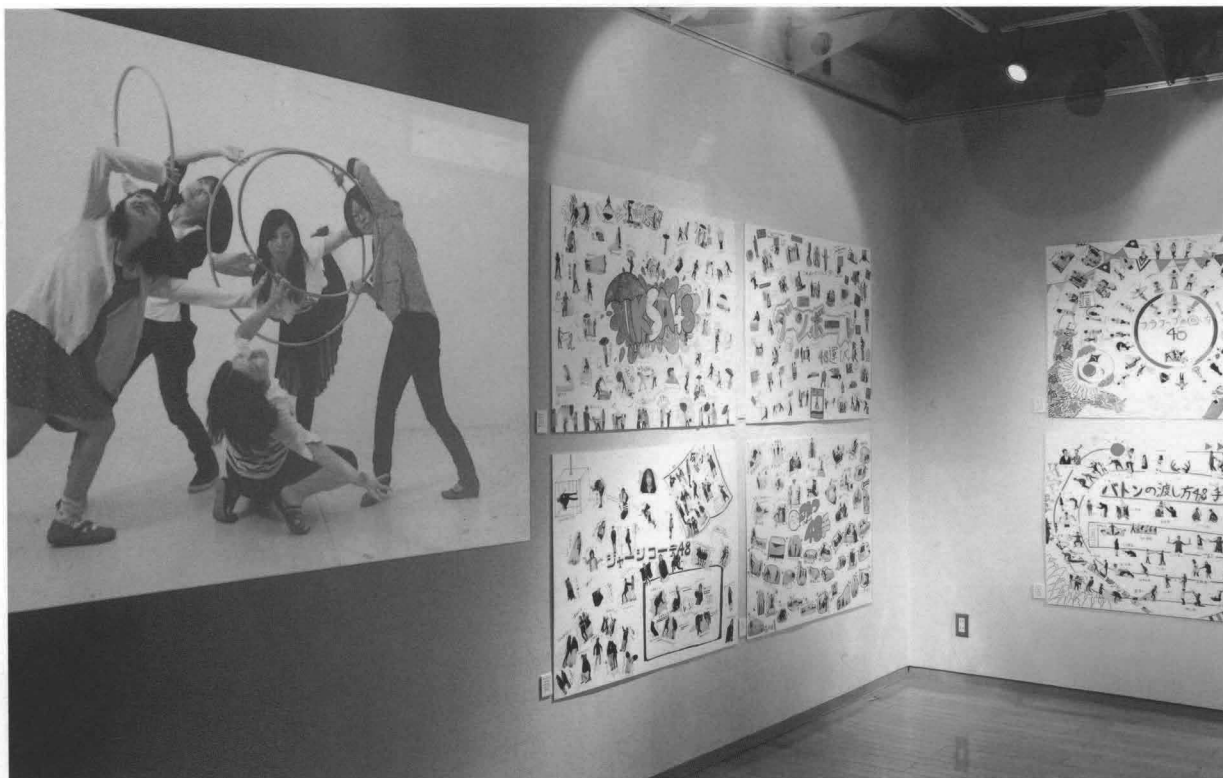
美大の教養展「新しい〇〇の仕方 四十八手」展示風景