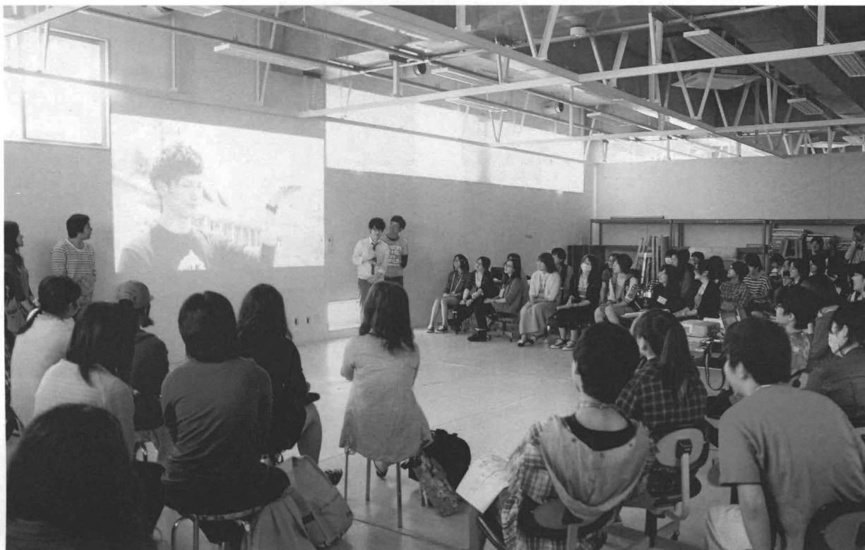
「雲の作り方」プレゼンテーションをグループごとに行っている様子。