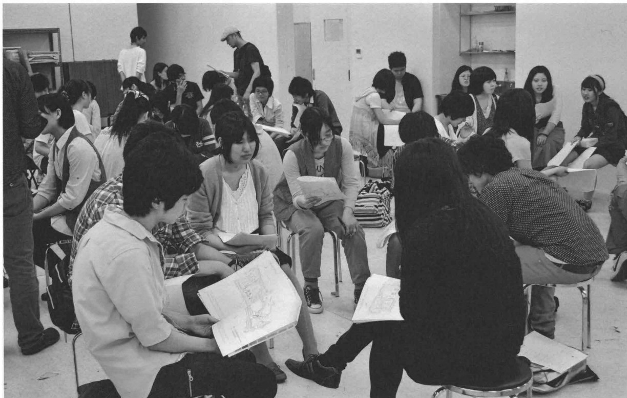
グループで話し合っ言葉の地図を作る。