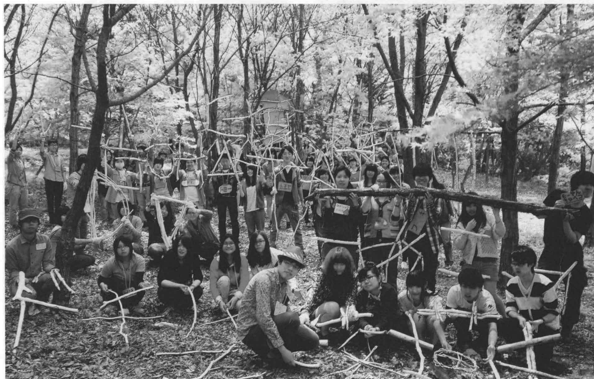
「チーム結成！」自然物を用いてチーム名を造形して提示している様子。