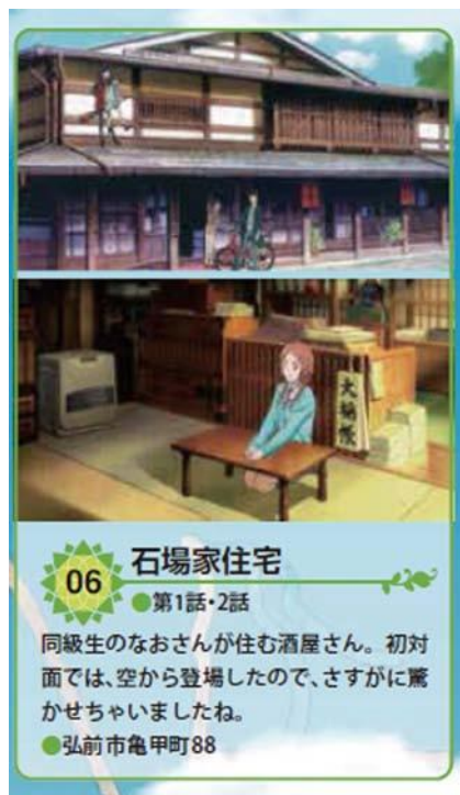
図2:アニメを使用したチトナビ(石場家)

『ふらいんぐういっち』をめぐる聖地巡礼は、旧来のアニメのように放送が契機となるわけではなく、前段階として漫画連載の状況で行われている。アニメーション制作の技術がレベルアップしているがゆえに、背景のリアルさがアニメ聖地巡礼を誘発しているという一般論は確かに存在するが(周藤2016)、この作品においてはアニメ聖地巡礼が取り組まれるスピードが変化しており、漫画段階での確認・発信作業、アニメ化とともに地元発信の地図やグッズ、さらには足跡のために交流ノートも置かれ、アニメ聖地巡礼で確認される出来事が一気に整備されていく。これはアニメ聖地巡礼がツーリズムの一つの形態として認識されていることの証左といえる。