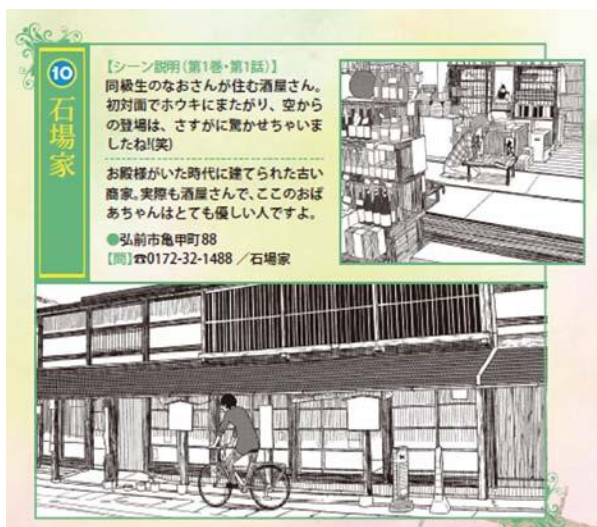
図1 漫画を使ったチトナビ(石場家)

これに対し、連載が進み、アニメが放送された後に作られた「チトナビ」では、舞台となった場所も増えている。これらだけではなくスマホアプリ「舞台めぐり」でも紹介されており、そのほかポスター制作やグッズ制作、イベントなど数多くのことが弘前市で行われていった。さらには図1・2で取り上げられている石場家では聖地巡礼ノートが2015年には置かれており、訪問者との交流が行われている。またアニメ放送後に発売されたDVD・BDでは映像特典として、出演している声優が実際の舞台をめぐる「舞台めぐり『うおーきんぐういっち』」、「舞台めぐり『さーちんぐういっち』」が収録されている。